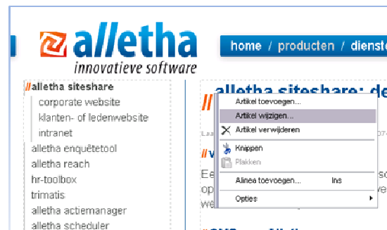
Inline bewerkingfuncties achter de rechter muisknop